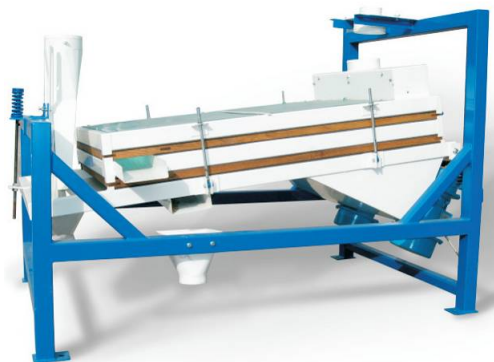
Univerzální třídíč KUT 800