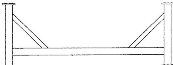
Příklad standardního podložného rámu pod čističku

Aby byly splněny veškeré bezpečnostní předpisy týkající se elektrické bezpečnosti zařízení, musí být elektroinstalace stroje provedena autorizovanou osobou. Pro doběh stroje je nutno řádně instalovat předepsanou brzdu doběhu. Nebezpečné vibrace při zastavování stroje mohou poškodit stroj nebo nosnou konstrukci!