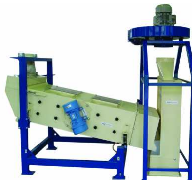
PVT 1000 + PASR 1000

Montáž zařízení a uvedení do provozu by měly být prováděny odborně vyškoleným personálem, seznámeným s postupem instalace strojů příslušného typu.