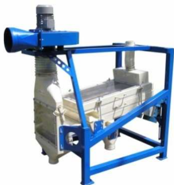
Univerzální třídíč KUT 500